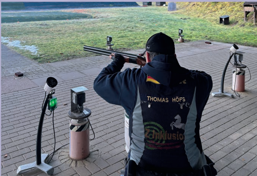
Der Test der Anonio Zoli F fand auf dem Schießstand Garlstorf statt. Die Flinte zeigte keine Schwächen beim sportlichen Schießen, ihr Schwungverhalten und das Trefferbild waren gut.

Sie lässt sich mit dem mitgelieferten Werkzeug einfach entnehmen, gerade für Wartungszwecke ein echter Vorteil. Wie bei Bockflinten üblich, kann der Schütze zwischen oberem und unterem Lauf wählen. Der Umschalter ist dabei dezent und gut erreichbar, im Schiebeschalter der Sicherung auf dem Kolbenhals des Schafts integriert. Diese Platzierung ist ergonomisch sinnvoll gewählt und erlaubt die Bedienung ohne Umgreifen. Gerade bei variablen Disziplinen ist das ein funktionaler Vorteil, den man schnell zu schätzen lernt. Der Schaft besteht aus schön gemasertem Nussbaumholz und hat optisch durchaus seinen Reiz. In puncto Haptik entspricht er jedoch nicht ganz meinem persönlichen Geschmack. Das Holz ist geölt, liegt angenehm in der Hand und wurde solide verarbeitet. Dank des verstellbaren Schafrückens lässt sich die Flinte ergonomisch gut anpassen. Der Vorderschaft ist sportlich geschnitten und bietet auch bei längeren Trainingseinheiten oder Wettkämpfen einen guten Griff. Insgesamt ergibt sich eine stimmige Ergonomie, die sich sowohl im Trap als auch im Parcours positiv bemerkbar macht. Die Flinte führt sich kontrolliert und lebendig, nie hektisch oder schwammig.